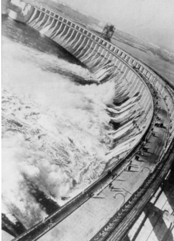
La construction d'une centrale électrique sur le Dniepr, une des plus grandes réalisations du 1 er plan quinquennal. Lorsqu'elle fut achevée en 1932, c'était la plus grande centrale du monde.