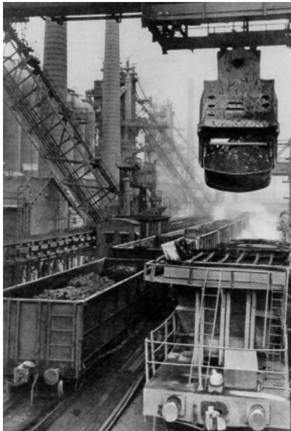
Le combinat métallurgique Staline à Kouznetsk et le combinat de Magnitogorsk comptent parmi les plus importantes réalisations du 1 er plan quinquennal.