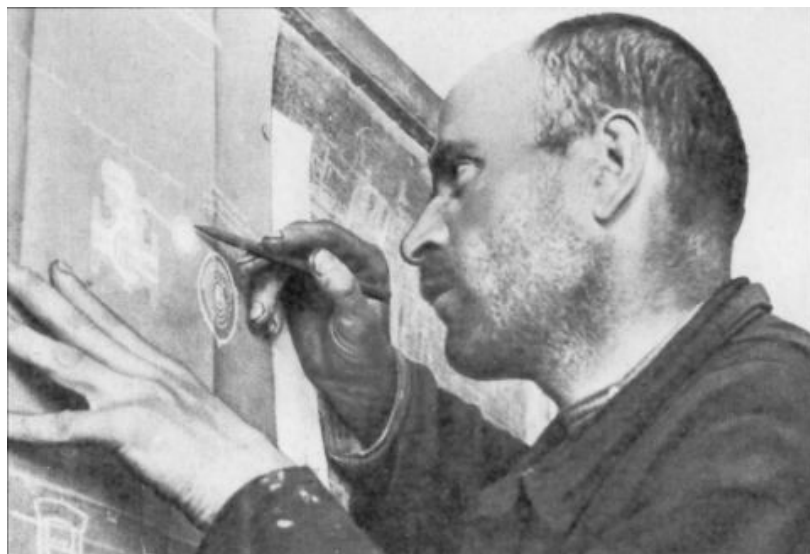
Des dizaines de milliers d'ouvriers compétents ont suivi des cours du soir, puis sont entrés à l'université pour devenir ingénieurs.