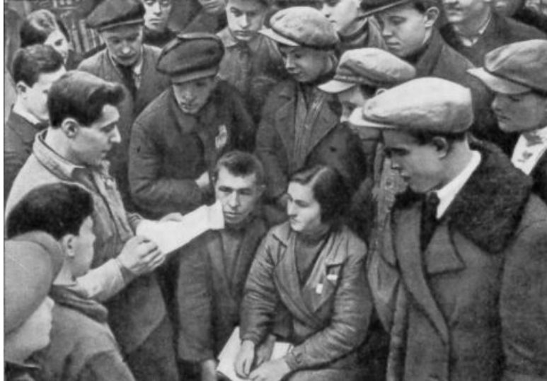
L'équipe internationale de l'Usine de roulements à billes de Moscou, 1933. Des centaines de techniciens et ingénieurs américains ont participé à l'édification économique de l'URSS. Le témoignage de Littlepage sur le sabotage contre-révolutionnaire dans l'industrie est capital.