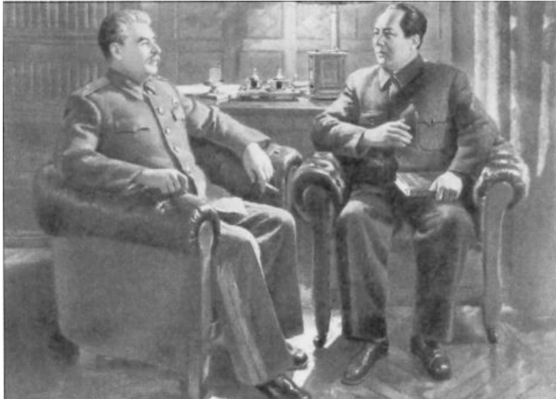
Mao Zedong rencontre Staline, décembre 1949 – janvier 1950. Tableau de Nalbandian. «Fêter Staline, c'est prendre parti pour lui, pour son oeuvre, pour la victoire du socialisme, pour la voie qu'il a indiquée à l'humanité» (Mao Zedong).