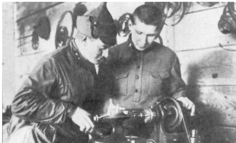
De jeunes paysans étaient alphabétisés et recevaient une éducation politique et technique à l'armée. Un commandant travaille au tour, à côté d'un jeune soldat.