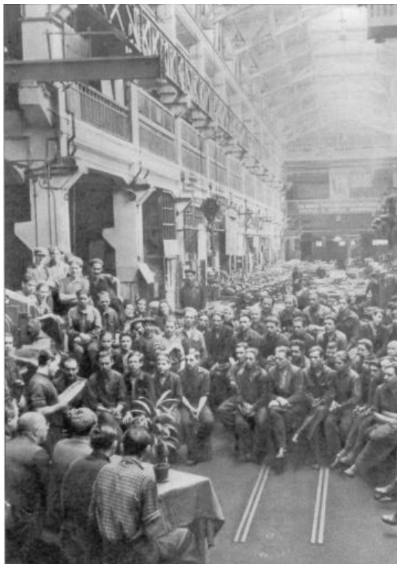
Des assemblées pour débattre des questions politiques eurent lieu dans les entreprises. L'épuration de 1937-1938 s'appuyait sur une grande mobilisation politique dans les entreprises pour préparer le peuple à l'agression fasciste.