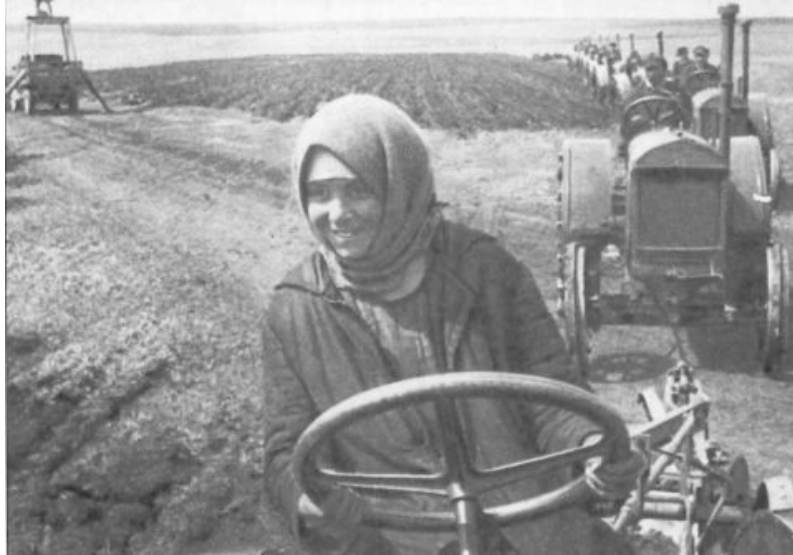
... et fêtent solennellement l'arrivée du premier tracteur.