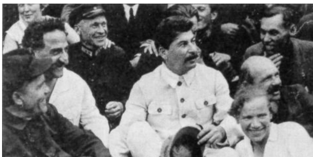
Kirov, Ordjonikidze et Staline, début des années trente. En 1934, l'opposition trotskiste-droitière organisa l'assassinat de Kirov, le numéro deux du Parti, pour se lancer dans une série de complots, d'actes de sabotage et de trahison. Cela a conduit à la Grande Purge de 1937-1938.