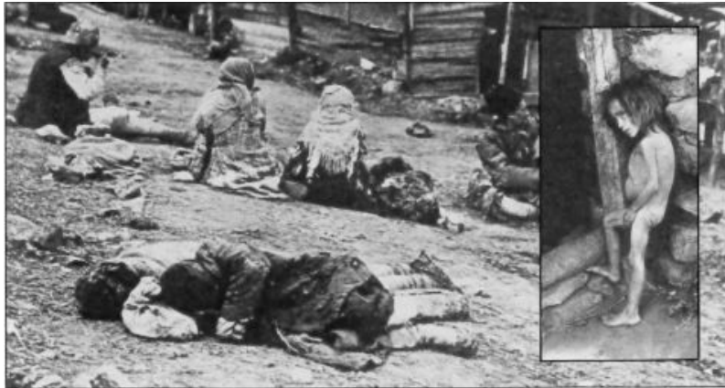
En 1921-1922, neuf millions de personnes sont mortes de la famine causée par les interventions étrangères. Les nazis utiliseront dans les années trente ces photos pour «prouver» la «famine artificielle» provoquée par Staline en Ukraine en 1932-1933...