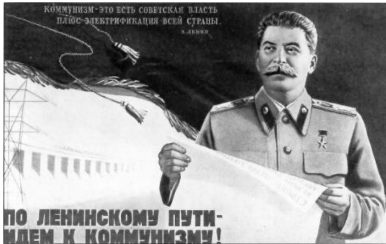
Affiche avec les paroles de Lénine: «Le communisme, c'est le pouvoir des Soviets plus l'électrification de tout le pays.» En 1920, Lénine proposa un grand plan d'électrification jusqu'en 1935. Staline l'a réalisé à 233 %.