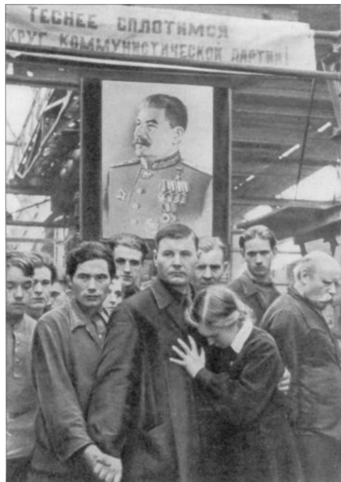
L'usine Ordjonikidze à Moscou. Au moment de l'enterrement de Staline, un silence de cinq minutes fut observé dans tout le pays. 4,5 millions de Soviétiques descendaient dans les rues de Moscou pour rendre hommage à Staline.