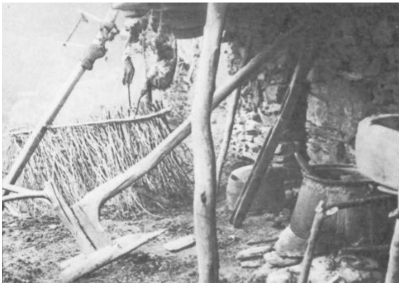
Les paysans brûlent les vieux instruments aratoires qui ont servi pendant des siècles.