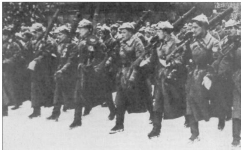
Le 7 novembre 1941, dans Moscou encerclée, Staline organise la parade militaire traditionnelle et déclare : «L'ennemi est aux portes de Leningrad et de Moscou. Le monde voit en vous une force capable d'anéantir les hordes d'invasion des bandits allemands».