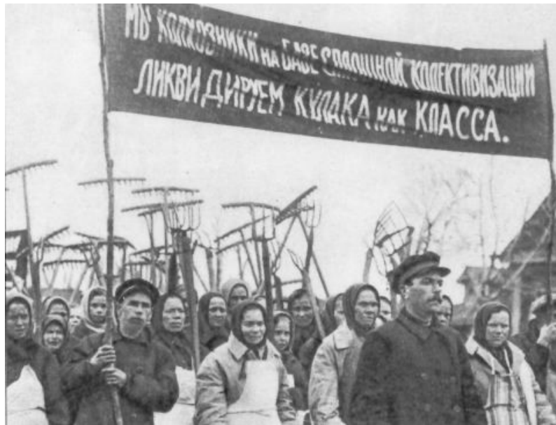
Sur le calicot : «Nous, kolkhoziens, nous sommes pour la collectivisation. Nous liquidons la classe des koulaks.»