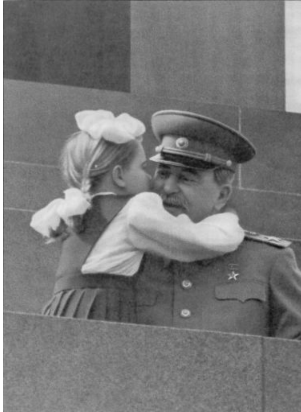
Staline au 1 er Mai 1952. Aujourd'hui, le peuple soviétique se rend compte que Staline a représenté la construction socialiste, l'indépendance, l'unité et la paix entre les nationalités, le bonheur au travail, le progrès, la culture et la démocratie socialiste.