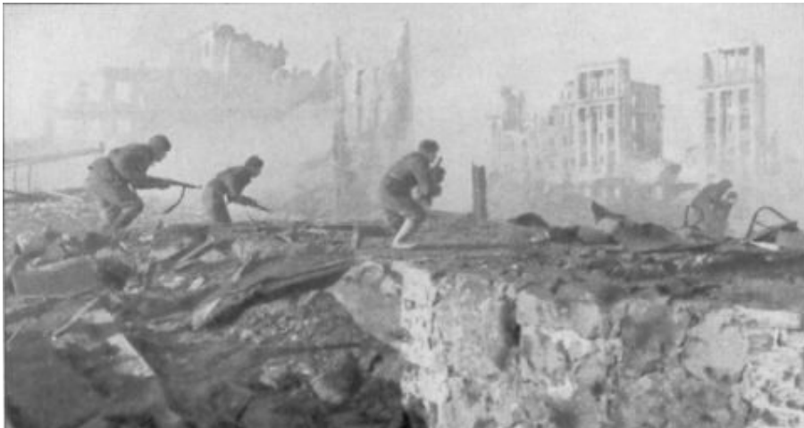
Les nazis ont mis toute la ville de Stalingrad enflammée, détruit jusqu'au dernier bâtiment, mais les soldats et les habitants n'ont jamais cessé la résistance...