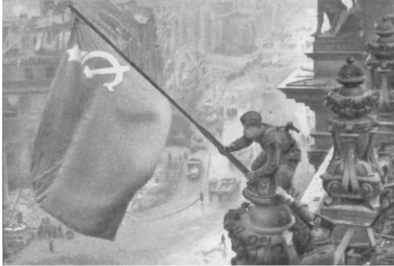
Le drapeau rouge flotte au-dessus de Berlin défait. Le véritable choix pour le XX e et XXI e siècle : fascisme ou communisme.