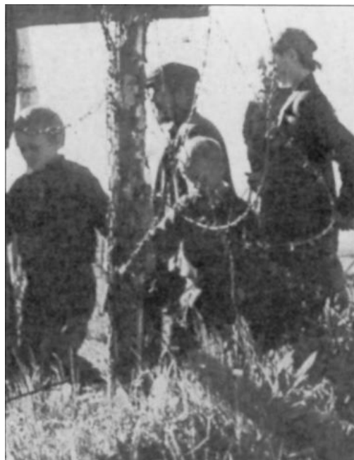
Des jeunes du Komsomol sont pendus à Minsk, au cours des premiers jours de la guerre.