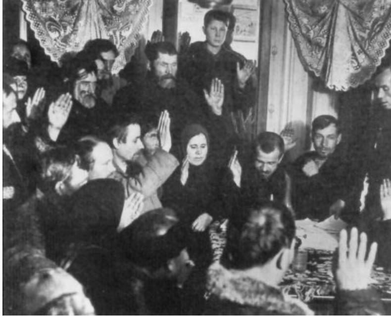
Lors de la première vague de collectivisation, en 1929, des paysans de la région de Kirov votent pour le kolkhoze.