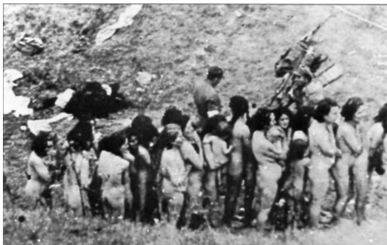
Des femmes, certaines avec des bébés, sont poussées dans un ravin pour y être abattues. Les exterminations en masse perpétrées par les nazis étaient dirigées en premier lieu contre les Soviétiques qui ont vu abattre et tuer 23 millions des leurs.