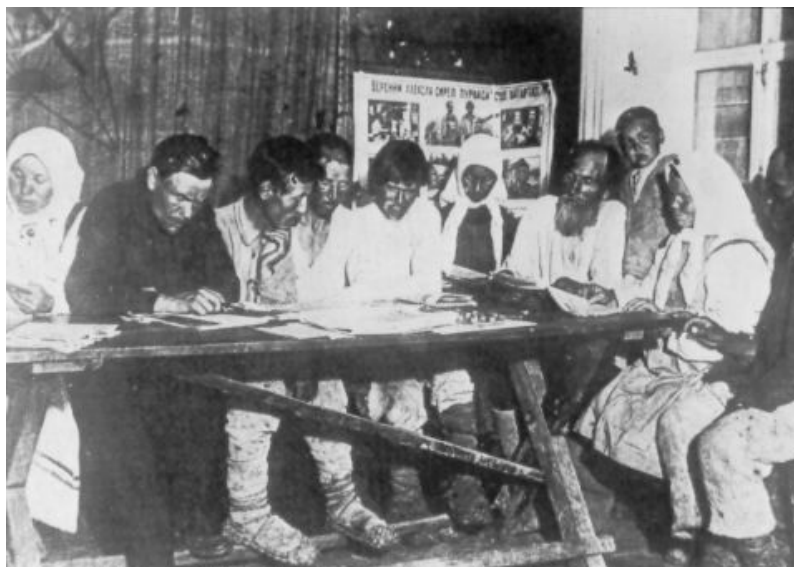
La première leçon dans un village du Kazakhstan. Les paysans passaient du féodalisme et de l'obscurantisme au socialisme et à la culture scientifique.