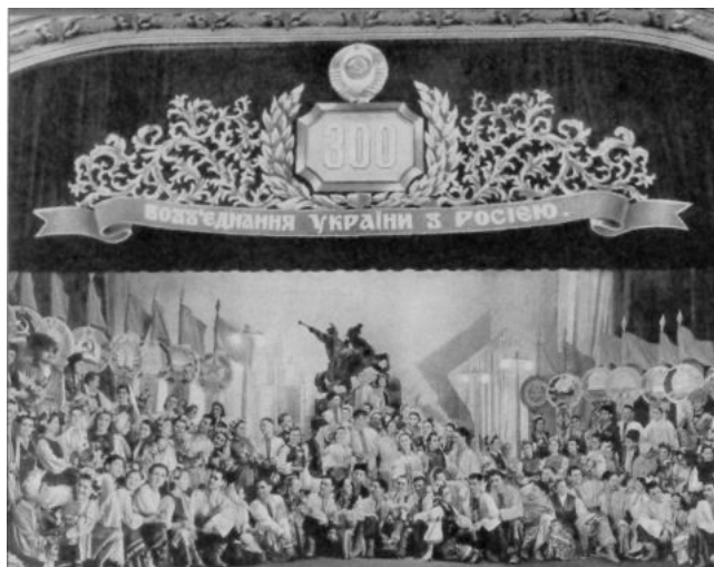
1954 : le 300 e anniversaire de l'unité entre l'Ukraine et la Russie fut fêté à Kiev par une soirée des meilleurs groupes artistiques d'ouvriers et de paysans.