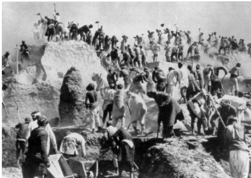
Le grand canal de Ferghana, construit entre 1935 et 1950, a permis d'irriguer une ceinture de culture cotonnière en Ouzbékistan, Kirghizistan et Tadjikistan. Les travaux en 1939.