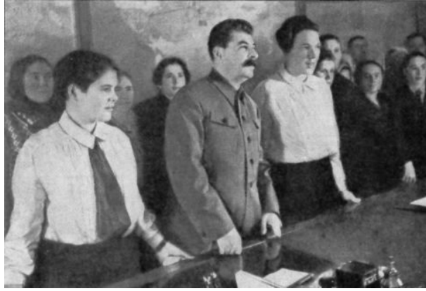
Staline lors de la réception en novembre 1934 des kolkhoziennes de choc cultivatrices de betteraves.