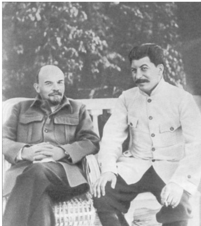
Lénine et Staline à Gorki en 1922. Dans l'absence de Lénine, malade, Staline était alors le principal dirigeant du Parti.