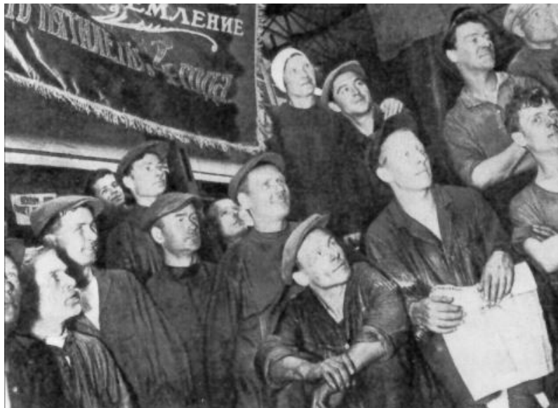
Une vue d'une assemblée générale où l'exécution de premier plan quinquennal par l'usine est discutée.