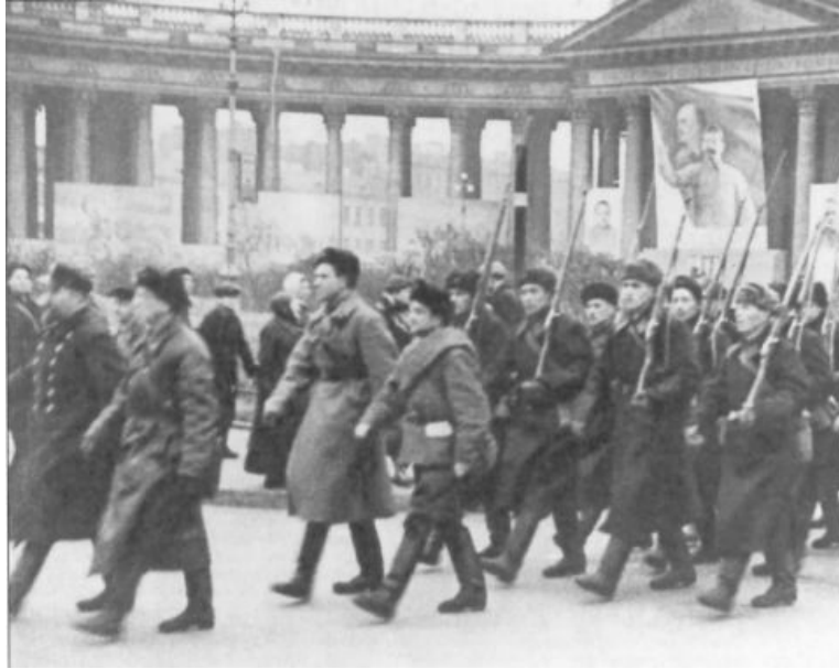
Octobre 1941 à Leningrad : les milices ouvrières. Encerclée par les nazis, la ville résista pendant les 900 jours du blocus. 641.803 Soviétiques sont décédés de famine mais Leningrad ne s'est pas rendue.