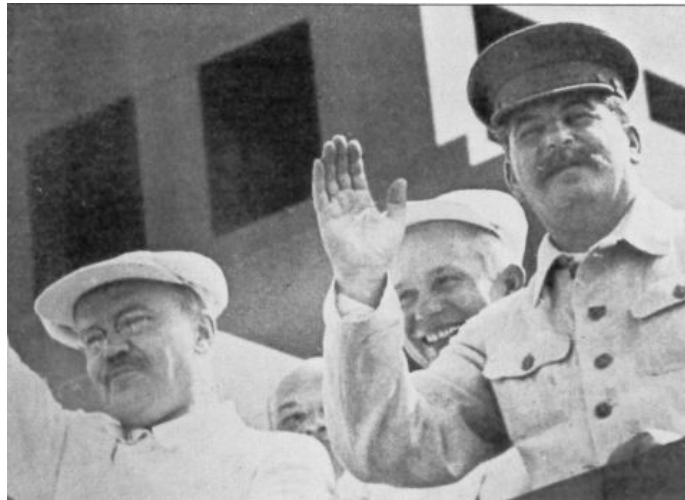
Le défilé du 1 er Mai 1934. En 1952, Staline avait mis en garde contre le révisionnisme, dont Khrouchtchev (centre) deviendra le chef de file. Molotov (à gauche) et Malenkov manquèrent de clairvoyance et d'esprit révolutionnaire après la mort de Staline.