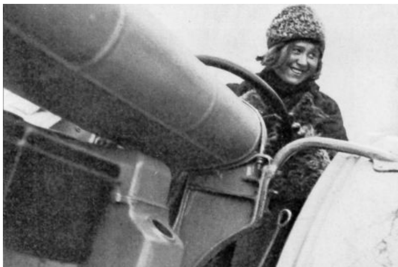
Des dizaines de milliers de jeunes paysannes, hier encore analphabètes, sont devenues des tractoristes et des techniciennes.