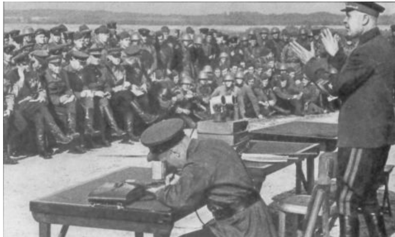
Automne 1940. Le maréchal Timochenko donne un cours aux officiers de Kiev. Entre 1939 et 1941, Staline s'est investi complètement dans la préparation de la résistance anti-fasciste.