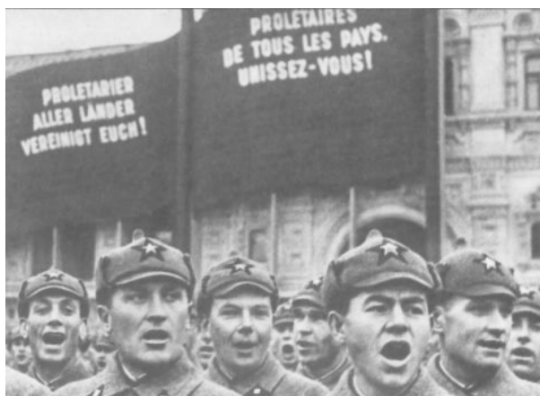
L'Armée rouge. Staline a toujours été un grand internationaliste. «Le pacte germano-soviétique a préparé les conditions de la victoire de l'Armée rouge contre les nazis».