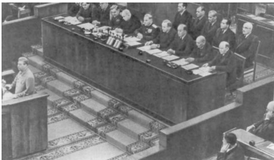
Staline au XIX e Congrès du Parti, en 1952. Le Rapport du Congrès était une mise en garde contre le bureaucratisme et le révisionnisme qui se répandaient.