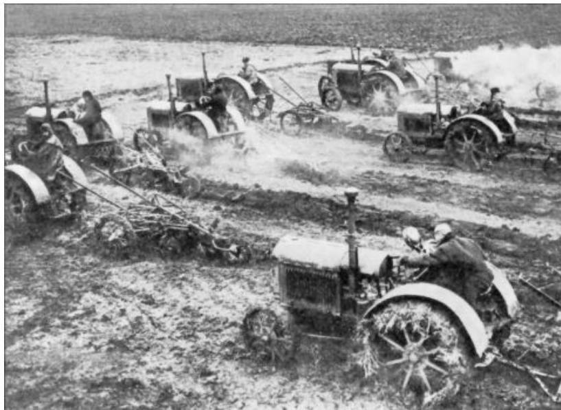
La mise sur pied de stations machines-tracteurs a révolutionné l'agriculture.